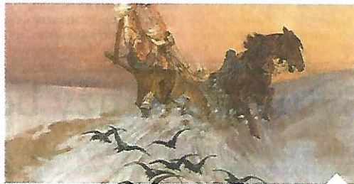
Stanisław Bohusz-Siesterzeńciewicz, „Wrony przed saniami”