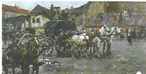
Stanisław Bohusz-Siesterzeńciewicz, „W miasteczku kresowym”