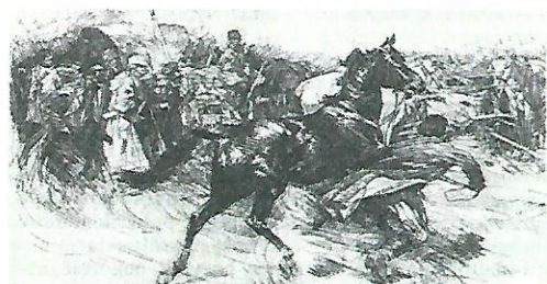
Stanisław Bohusz-Siesterzeńciewicz, rysunek piórkami | Fot. Wikipédia